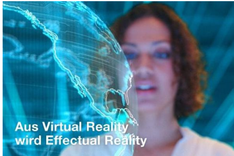
(Foto: hl-studios, Erlangen): Aus Virtual Reality wird Effectual Reality- hl-studios auf der HM17

Presseagentur: hl-studios GmbH - Agentur für Industriekommunikation