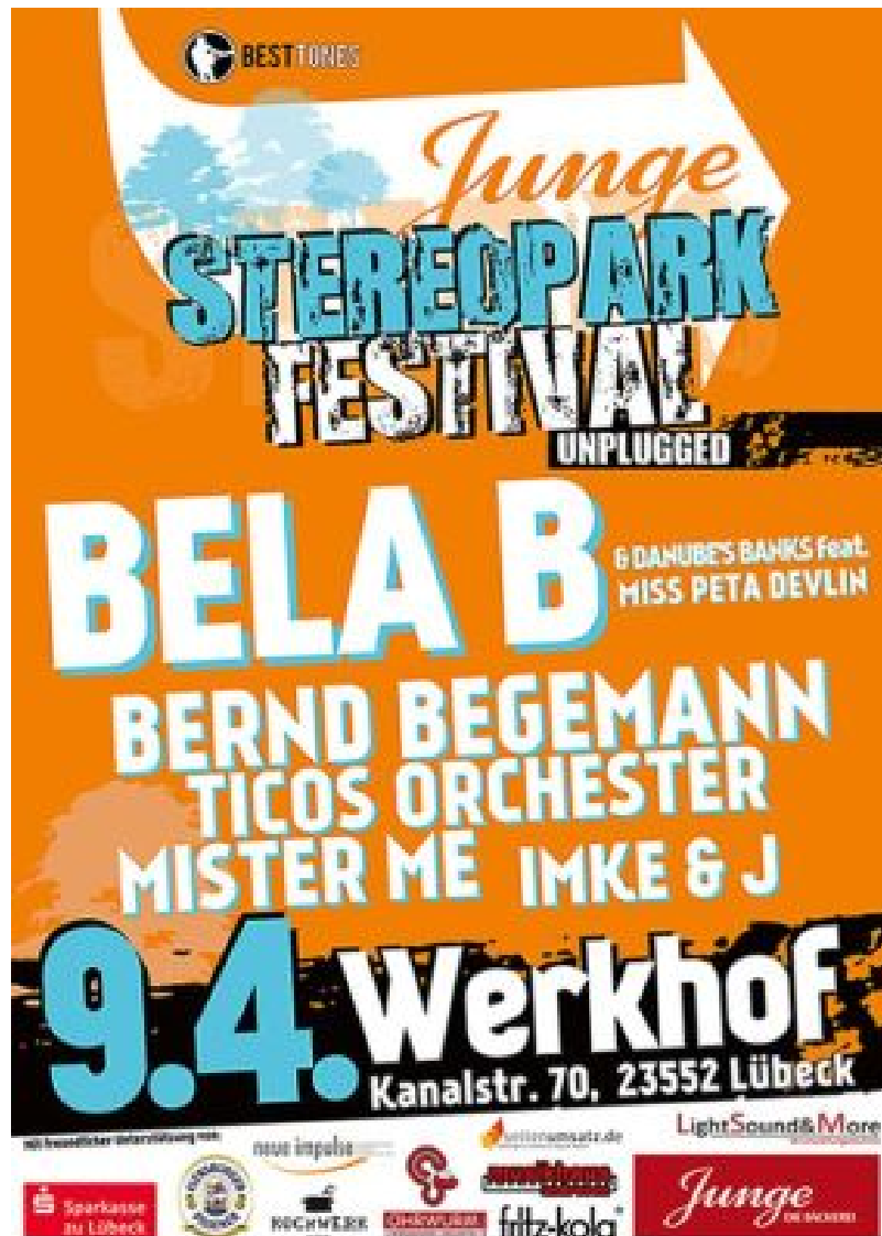
Junge Stereopark Festival - Plakat

"...das erste und für lange Zeit einzige Konzert der B-NUBE'S (BELA B mit DANUBE'S BANKS feat. MISS PETA DEVLIN) exklusiv auf dem Junge Stereopark Festival in Lübeck"