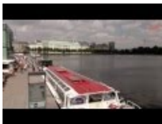
Imagefilm der LI - Werbeagentur Hamburg

Zu allen Themen stehen wir jederzeit für Fragen zur Verfügung und beraten gerne bei der richtigen Auswahl von Produkten und Dienstleistungen rund um das Thema responsive Webdesign und SEO. Wir jedenfalls freuen uns auf die weitere fruchtbare Zusammenarbeit mit Alberts & Fabel und viele weitere spannende Blogbeiträge!