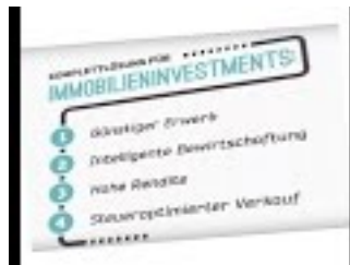
Book Trailer zu "Geld verdienen mit Wohnimmobilien"

Eine durchaus aussagekräftige Informationsquelle zur Absicherung des ermittelten Wertes der Immobilie nach dem Ertragswertverfahren sind die amtlich ermittelten Bodenrichtwerte für Grundstücke und die Markttrichtwerte für Wohnungen. Diese Daten beruhen nicht auf dem Ertragswertverfahren, sondern auf dem Vergleichswertverfahren. Grundlage für die jährlich aktualisierten Veröffentlichungen dieser Zahlen durch den Gutachterausschuss sind die in der Gemeinde tatsächlich erfolgten Grundstücksverkäufe, die von den Notaren gemeldet werden müssen. Die Ergebnisse dieser Arbeit werden der Allgemeinheit in Form von Bodenrichtwerttabellen und Bodenrichtwertkarten zugänglich gemacht, die gegen eine Gebühr bei den Gutachterausschüssen bezogen werden können (siehe http://www.gutachterausschuesse-online.de ). Der Bodenrichtwert ist ein Durchschnittswert, der auf den Quadratmeter Grundstückfläche herunter gebrochen ist. Die Gutachterausschüsse ermitteln darüber hinaus Markttrichtwerte für Eigentumswohnungen, indem auch hierfür durchschnittliche Preise pro Quadratmeter Wohnfläche ermittelt werden. Da die von den Gutachterausschüssen ermittelten Zahlen und Darstellungen aus tatsächlichen Vertragsabschlüssen und den daraus gewonnen Daten abgeleitet werden, sind diese Zahlen durchaus aussagekräftig. Diese Werte können Sie zur Plausibilisierung des Kaufpreises heranziehen, den Sie anhand der Marktmiete und anhand des relevanten Vervielfältigers ermittelt haben.