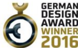
LED Beleuchtungssystem STRAPLED Advanced

„Eine funktional durchdachte und dezente Gestaltung rückt bei diesem LED Beleuchtungssystem gekonnt in den Vordergrund.“ – so lautete die Begründung der Red Dot Jury, die STRAPLED Advanced bereits Mitte des Jahres mit dem „Red Dot Award 2015 Winner Lighting Design“ auszeichnete.