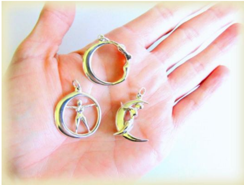
Die drei Variationen der Mondgöttin

Pressemitteilung von: Sinworks Schmuckdesign