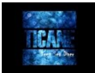
Deep Sea Diver (Radio Mix) - Ticane

Die Single ist ab 15.01.2015 in den gängigen Download-Portalen erhältlich.