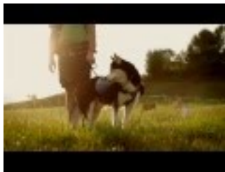
100 Tage Heimat -- Das Interview zum Buch

https://www.youtube.com/watch?v=NnSfr80UUQM