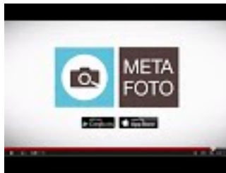
META FOTO Erklärvideo

Die Metafoto-App steht sowohl in Apples als auch Googles App Store zum kostenlosen Download zur Verfügung. Derzeit werden zehntausende Fotos aus Berlin, Bremen, Trier, Rosenheim, den Landkreisen Wetterau und Main-Kinzig, Baden-Württemberg sowie der Schweiz gesucht. Weitere Missionen sind in Arbeit.