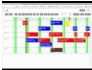
Hotelprogramm, Hotelsoftware VAKANZAonline - Buchung erstellen

VAKANZAonline ist eine Software, die bereits viele Vermieter aufgrund der durchdachten Funktionen und der einfachen Bedienung überzeugt hat. Auf der Internetseite ( www.vakanza-online.de ) können Sie eine Testversion anfordern oder noch einfacher – rufen Sie einfach an (0 83 61 – 92 57 24) und lassen Sie sich die Software bei einem Termin ganz unverbindlich zeigen.