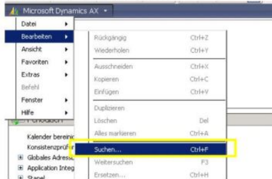
Intelligenter Datenagent in GIN-AX

Suchen ist lästig, vor allem, wenn viel Zeit dafür verbraucht wird. Schnelles Finden ist besser! Mit dem Maklerverwaltungsprogramm GIN-AX bekommen Sie gleichzeitig eine Schnellsuche in die Hand, die z.B. in der Finanzbuchhaltung viel Zeit spart.