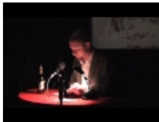
CKLKH Fischers Große Kannibalenschau

www.cklkh.de / www.facebook.com/periplaneta / www.periplaneta.com