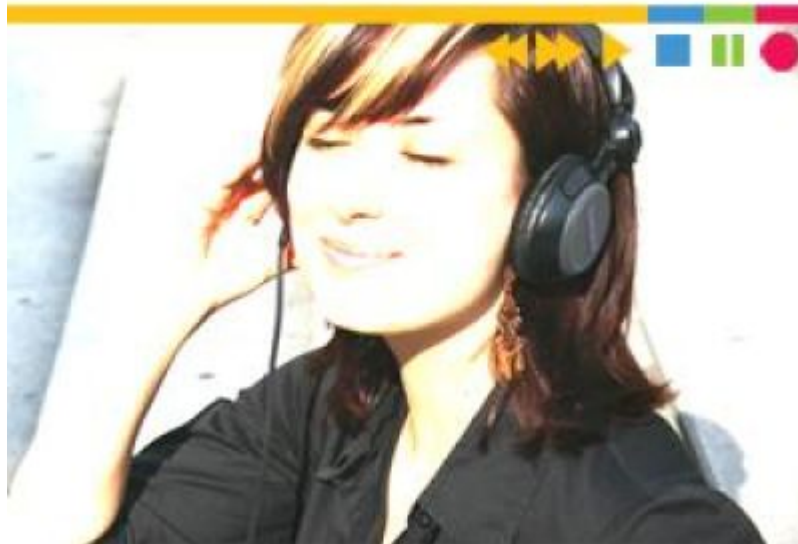
MFG Innovationcast, Podcast-Angebot der MFG Baden-Württemberg