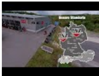
GSZ - GABELSTAPLER ZENTRUM Video

GSZ Gabelstaplerzentrum GmbH Herr Erich Janusch Untere Breite 10, 72144 Dußlingen Deutschland Telefon: +49 (0) 7072 600 4 100 E-Mail: info@gabelstapler-zentrum.de Web: gabelstapler-zentrum.de