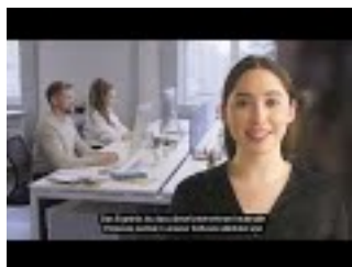
Anpassbare und erweiterbare ERP-Software

*Alle Preise zzgl. 19% MwSt. und gültig bis zum 31.03.2024 ** Alle Preise zzgl. 19% MwSt., inklusive 5-User-Lizenz des MBS FileMaker Plugin (Vollversion, kann mit eigenen Lösungen verwendet werden), exklusive FileMaker Pro.