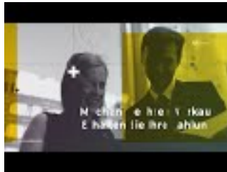
MindOfis Franchise System

www.mindofis.com MindOfis OÜ Tallinn, Estland