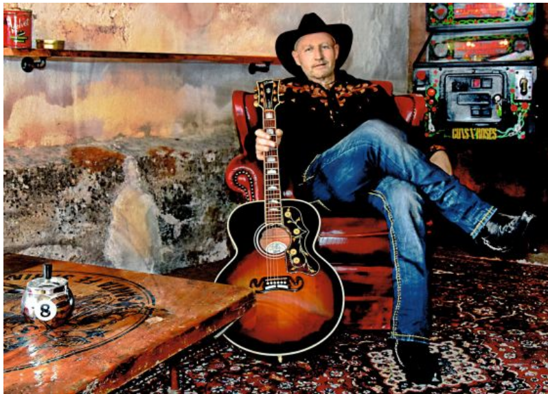
Autogrammkarte HolleGreat - die ultimative Fan-Postkarte!

Pressemitteilung von: HolleGreat - Bavarian Country & Lifestyle Presseagentur: HolleGreat