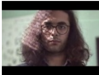
First Impression - Four Blue Passion

https://www.youtube.com/watch?v=uQqRe9hSd8Y