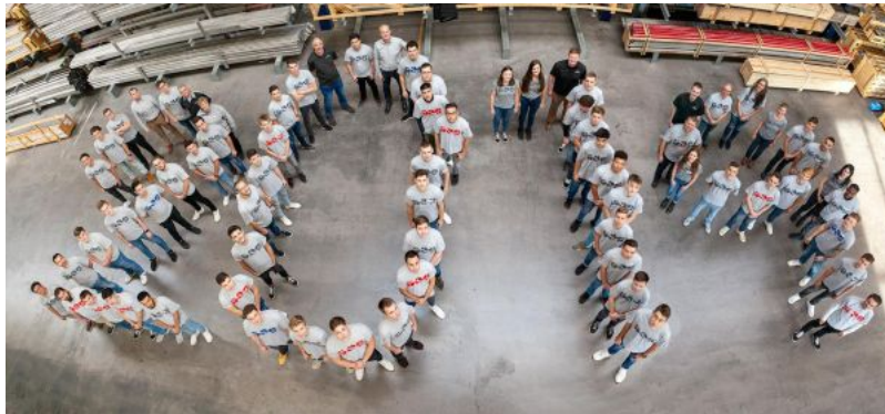
Azubis der Firmen KIESELMANN, Gross, Guth Pharmatec und Rieger mit Ausbilderinnen und Ausbildern