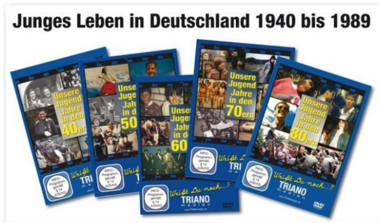
Eines von vielen TRIANOmedien-Film-Geschenk-Sets: "Unsere Jugend-Jahre in den 40ern + 50ern + 60ern"

TRIANOmedien, Windhagen Filmproduktion mit ZÜGIGEM Direktversand aus der Produktion direkt an Besteller, erinnert an das Lebensgefühl der Jugendlichen in früheren Jahrzehnten. Sei es in den 40er, 50er, 60er, 70er oder 80er Jahren: Damals, als man noch jung war. An die Zeit, die den meisten Menschen - gleich welchen Alters - als am schönsten mit im Gedächtnis haften geblieben ist: Goldene Erinnerungsnostalgie oder schöne Wirklichkeit? Oder beides?