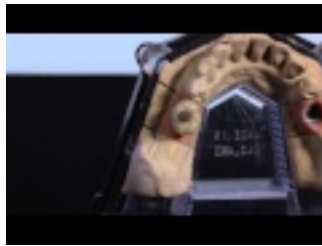
Silver Plug Gebrauchsanweisung

https://www.youtube.com/watch?v=n9QD_O96bsY